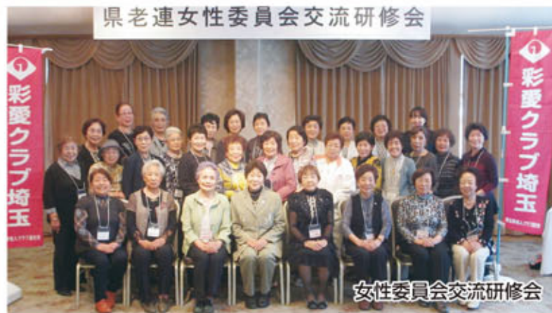
県老連女性委員会交流研修会