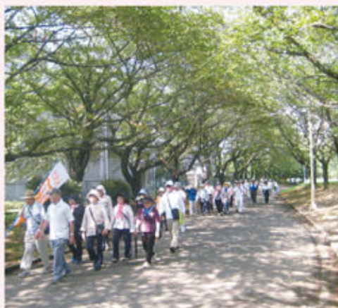
にいざ元気アップウォーキングの様子

※老人クラブの役割：各コースの設定及び検討、受付、準備体操、誘導、安全確認の役割を担っています。