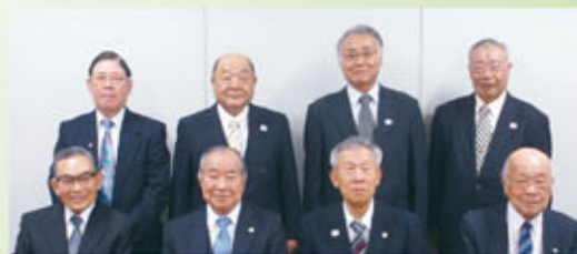
県老連広報委員会委員