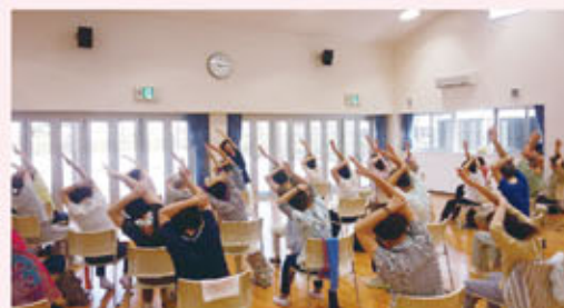
にいざ元気アップ広場の様子

※老人クラブの役割：会場の準備、片付け、受付、反省会への参加等の役割を担っています。