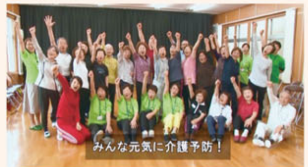
みんな元気に介護予防!

TODA元気体操を始めて、参加者から、「歩行や階段の昇り降りが楽になった!」、「外出する習慣がついた!」といった声を頂いています。一方で、休みがちな方やなかなか外出する頻度が少ない方に参加してもらうために、より魅力的な場づくりを進めていく必要があると考えています。TODA元気体操に参加している方が、その町会の老人クラブに加入した事例もありましたので、体操の参加者・老人クラブの会員を共に増やせるよう今後も積極的に取り組んでいきたいと考えています。