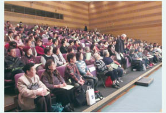
大結集の「芸能の集い」

を行っております。市長のあいさつがあり約350人が集い、5時間ほどのすばらしい発表があり、会員外の方、身体の不自由な方、ひきこもりの方をみんなで連れ出し、大結集の大会となっております。世代間交流では、育成会と町会と連携し、グラウンド・ゴルフを子供達に教え、大人と共に楽しんでいます。