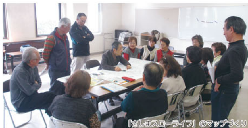
【さしまスローライフ】のマップづくり