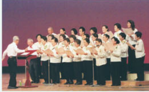
コーラス部の活動

を行っております。市長のあいさつがあり約350人が集い、5時間ほどのすばらしい発表があり、会員外の方、身体の不自由な方、ひきこもりの方をみんなで連れ出し、大結集の大会となっております。世代間交流では、育成会と町会と連携し、グラウンド・ゴルフを子供達に教え、大人と共に楽しんでいます。