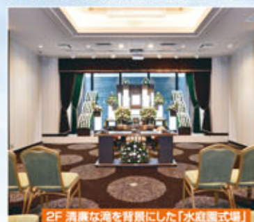
2F 清潔な海を背景にした「水庭園式場」

庭園式場に家族葬専用式場、充実のご葬儀施設が誕生いたしました。 是非ご来館いただき、蕨ホールの最新設備をご覧ください。