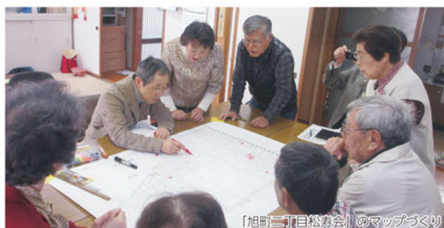
【旭町二丁目松寿会】のマップづくり