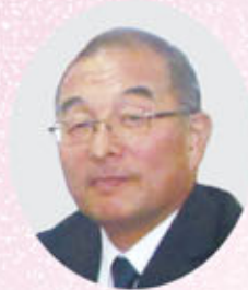
県警生活安全部長 警視正 宮谷定雄氏