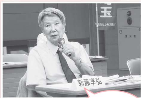
市町村老人クラブ連合会会長研修会にて質問に答える