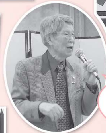
マイクの持ち方とこの顔は大好きなカラオケですネ!