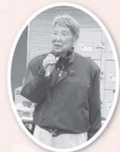
健康づくり大学卒業式の懇親会でお楽しみです