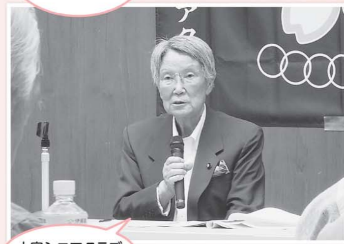
大宮シニアクラブ総会にて