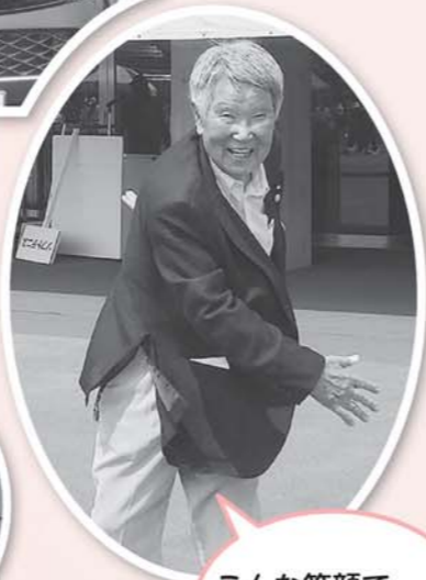
こんな笑顔で(県スポーツ大会)