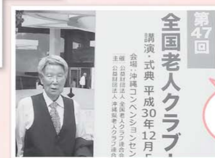
沖縄大会へ事前調査