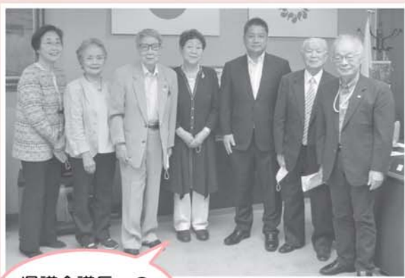
県議会議長への表敬訪問