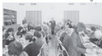
白藤会の設立準備総会

これは老人クラブが解散となつている「藤久保二区」へ連合会より、再結成の要請をしたところ、地元の有